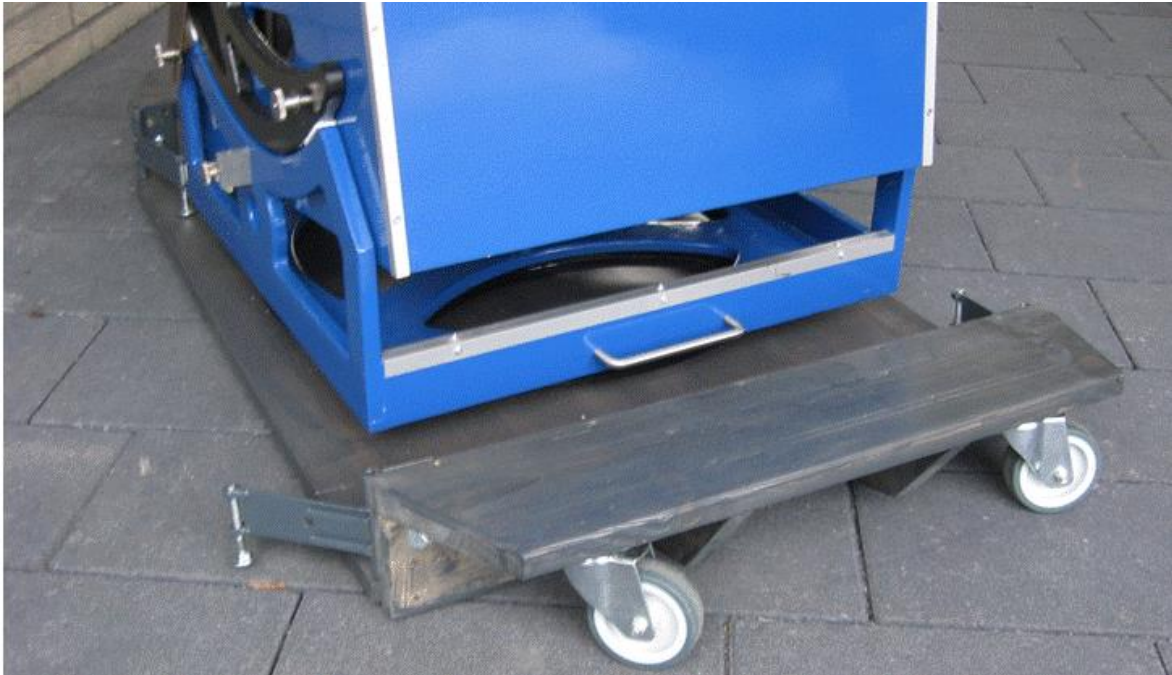
Ansicht der abgesenkten Plattform mit den hochgeklappten Rädern.